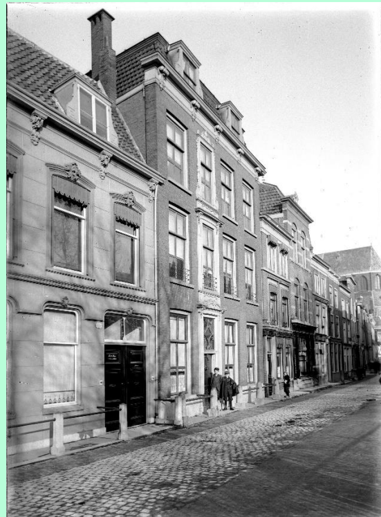
Nieuwsteeg ca. 1900

Het gezin woont lange tijd, vanaf 1900, of misschien wel eerder, in de Nieuwsteeg op nr. 6.