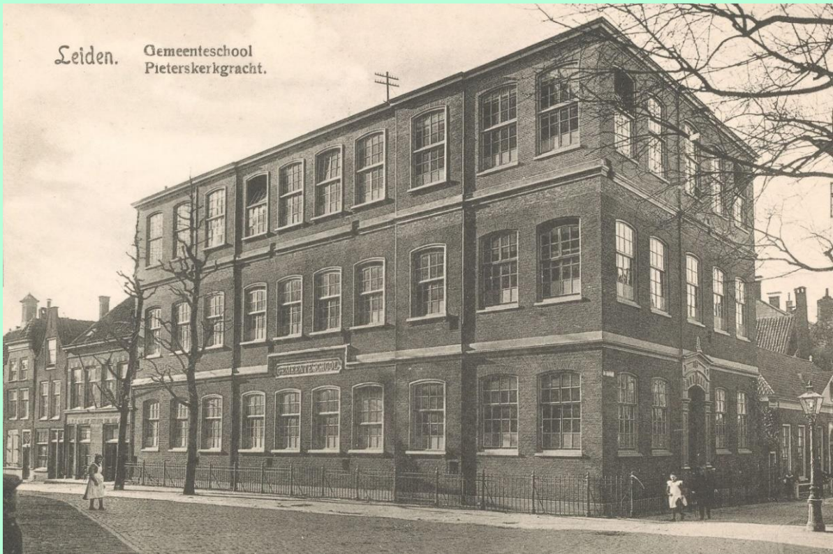
Gemeentelijke school aan de Pieterkerkgracht